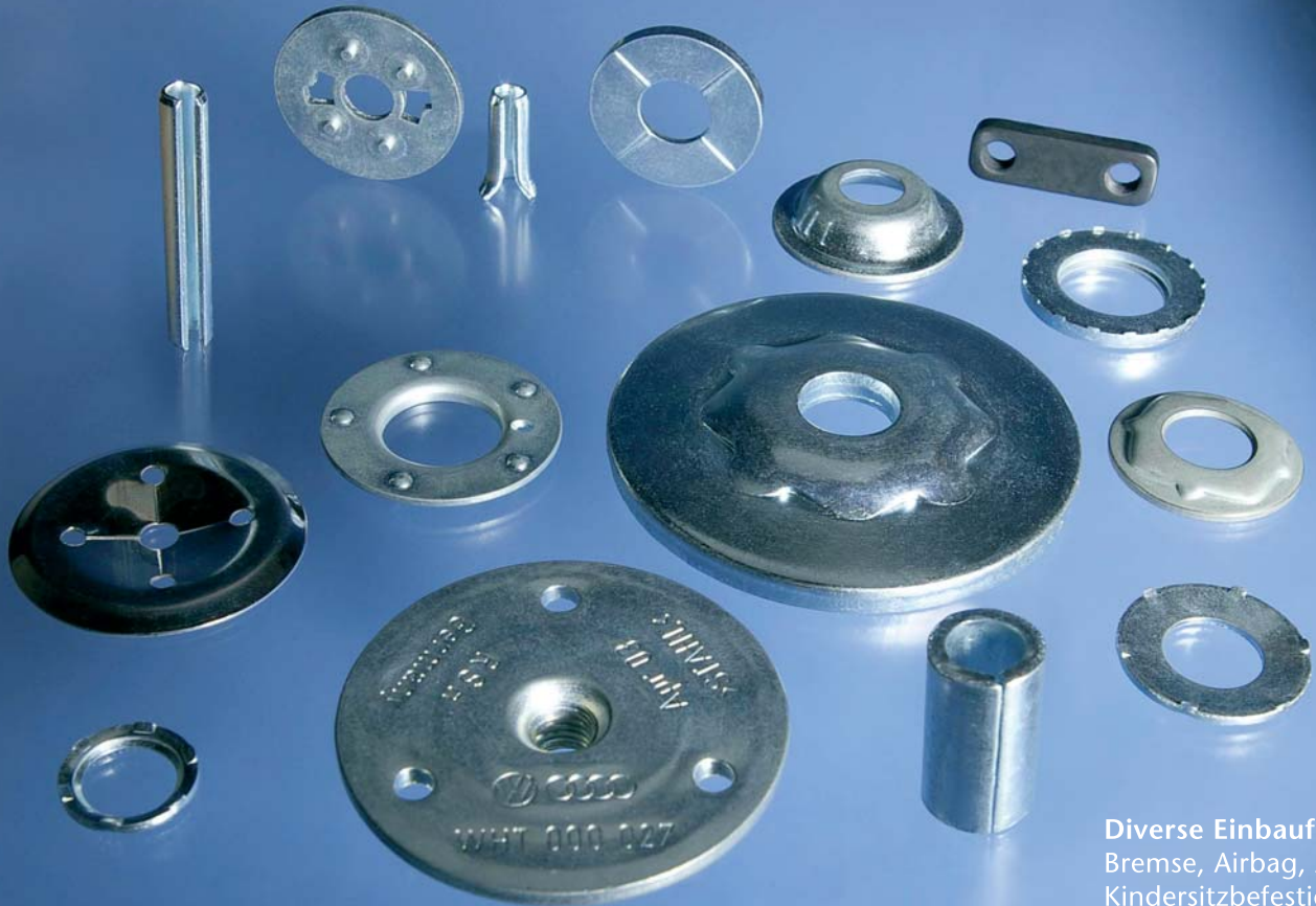
Diverse Einbaufälle: Bremsen, Airbag, Antenne, Kindersitzbefestigung etc.

Wir sind ein seit 1902 erfolgreiches mittelständisches Unternehmen, das Artikel aus Federstahl produziert. Seit Jahrzehnten betreuen wir mehr als 500 Kunden in 33 Ländern. Diese Kontinuität zeigt, dass es unser wichtigstes Ziel ist, unseren Kunden genau die Produktlösungen anzubieten, die sie benötigen.